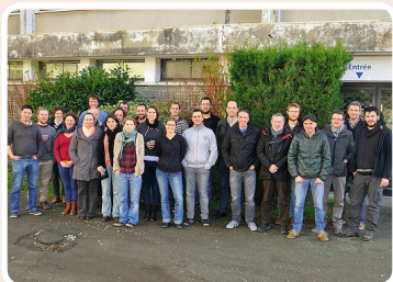
Structures et naturalistes réunis lors du lancement de l'Atlas en janvier 2016.

Un atlas est un projet participatif qui présente, sur une période déterminée, une photographie de la répartition et du statut des espèces sur un territoire.